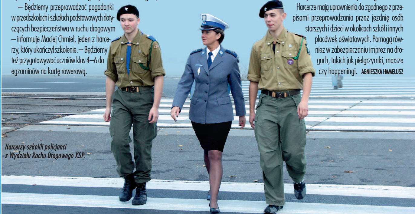
Harcerzy szkolili policjanci z Wydziału Ruchu Drogowego KSP.

Harcerze mają uprawnienia do zgodnego z przepisami przeprowadzania przez jezdnię osób starszych i dzieci w okolicach szkół i innych placówek oświatowych. Pomogą również w zabezpieczeniu imprez na drogach, takich jak pielgrzymki, marsze czy happeningi. AGNIESZKA HAMELUSZ