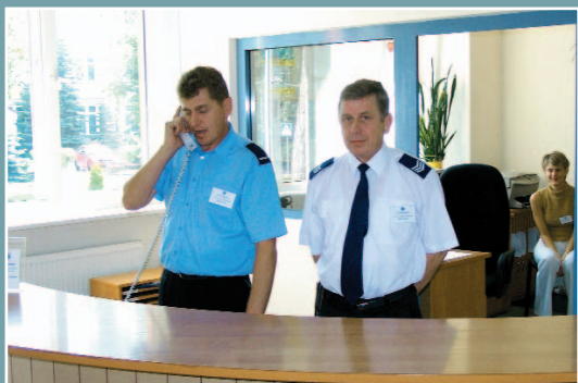
Przyjazne punkty obsługi interesanta.

Celem jej utworzenia jest właściwe prowadzenie rekrutacji zewnętrznej i wewnętrznej pracowników, analiza stanu zatrudnienia, określenie potrzeb oraz prognozowanie ruchów kadrowych w KSP.