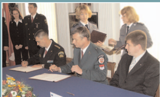
W KSP podpisano umowę z policjantami Rygi, Wilna i Tallina.