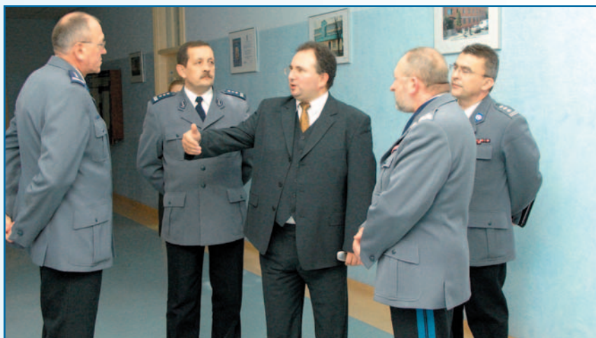
Komendant Główny Policji Marek Bieńkowski z zainteresowaniem pytał kadrę kierowniczą KSP o szczegóły przeprowadzonych inwestycji.

— Przez ostatnie lata pełniąc funkcję Zastępcy Prezydenta m. st. Warszawy współpracowaliśmy na wielu płaszczyznach — mówił Wiceminister Spraw Wewnętrznych i Administracji Władysław Stasiak. — To były dobre lata, w których udało się zrealizować wiele cennych i ważnych koncepcji. Liczę, że zachowamy ten dobry klimat i Komenda Stołeczna Policji będzie przykładem sprawnej i profesjonalnej instytucji dla całego kraju. Zapewniam, że plany Ministra Spraw Wewnętrznych i Administracji to nie słowa, rzucane na wiatr. Stawiamy na skuteczność w Policji i orientację na dobry efekt. Liczymy na zaangażowanie, inicjatywę i dobrą pracę.