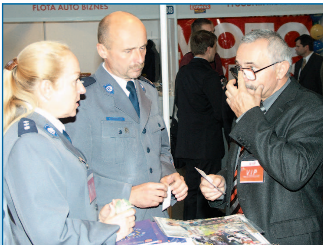
Kierowcy byli zainteresowani szczególnie programem do rekonstrukcji wypadków drogowych.

Sprzęt transportowy, jakim dysponują policjanci Komendy Stołecznej mieli okazję obejrzyć odwiedzający V Międzynarodowe Targi Motoryzacyjne Moto Show 2005 (04–06.11.2005).