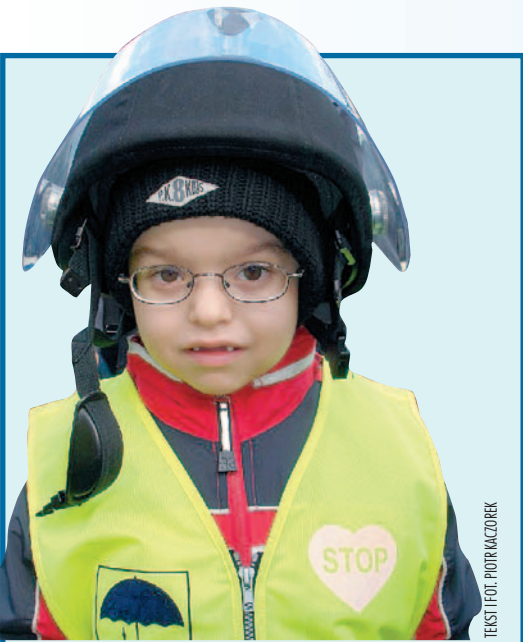
TEKST I FOT. PIOTR KACZOREK

Policjanci z Komisariatu na Białolece od początku sierpnia mieli pełne ręce pracy. Rozwiązywali kryminalne równanie z dwiema niewiadomymi. Jedną niewiadomą były oszustwa przy oferowaniu pracy w Niemczech i Wielkiej Brytanii, drugą oszustwa przy proponowaniu mieszkań do wynajęcia.