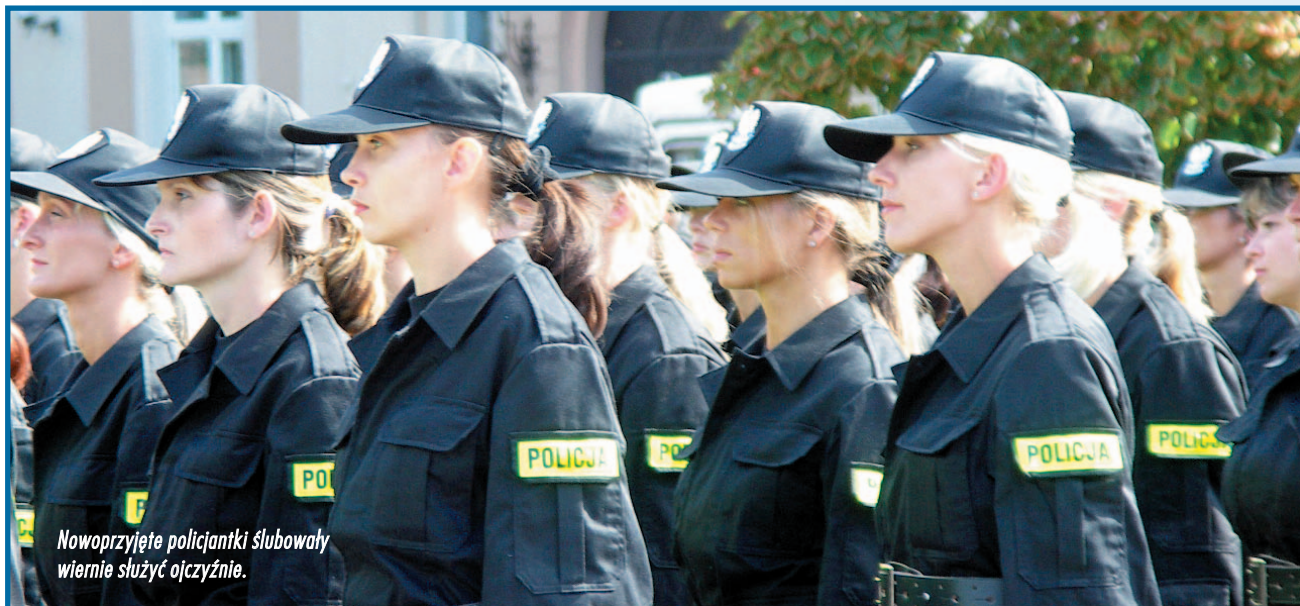
Nowoprzyjęte policjantki ślubowały wiernie służyć ojczyźnie.