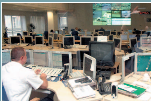
Nowoczesne stanowisko wspomagania dowodzenia.