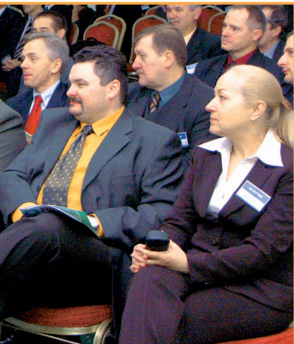
FOT. TOMASZ BEDNAREK