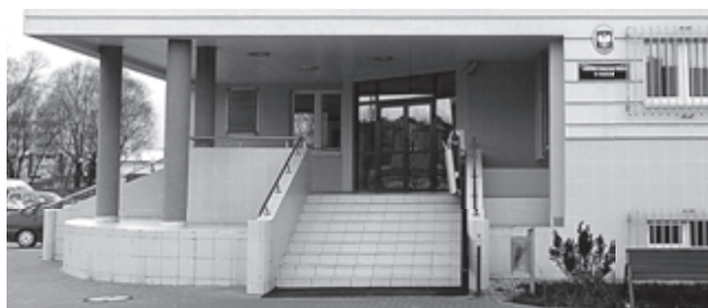
Komenda Powiatowa Policji w Piasecznie

Odszedł w zapomnienie koloryt świata za miastem. Witamy na przedmieściach stołecznej aglomeracji.