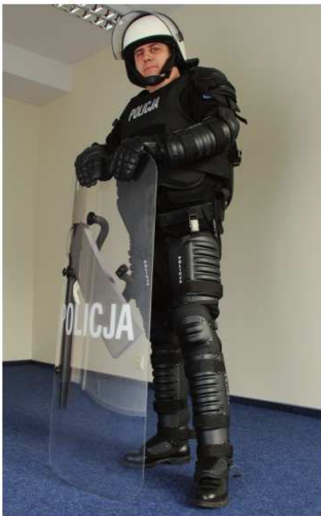
Nieetatowych Grup Rozpoznania Minersko-Pirotechnicznego oraz narkotesty.